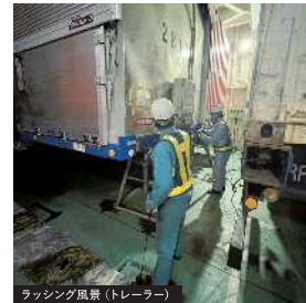
ラッシング風景（トレーラー）