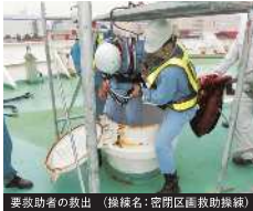
要救助者の救出（操練名：密閉区画救助操練）