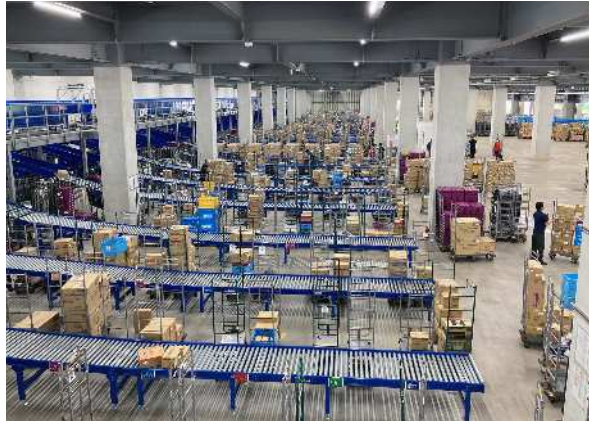
自動仕分けゾーン