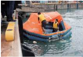
正常状態の救命いかだ