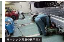
ラッシング風景（乗用車）