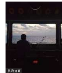
航海当直 コース220 ヨソロー（針路保持）

航海中の航海士は担当する時間（0時～4時、4時～8時、8時～0時）に24時間体制で航海当直を行う。機関士は、エンジンルームで各機器が正常運転できるように整備を行う。甲板長は航海中にてできる整備・点検・管理をおこなう。