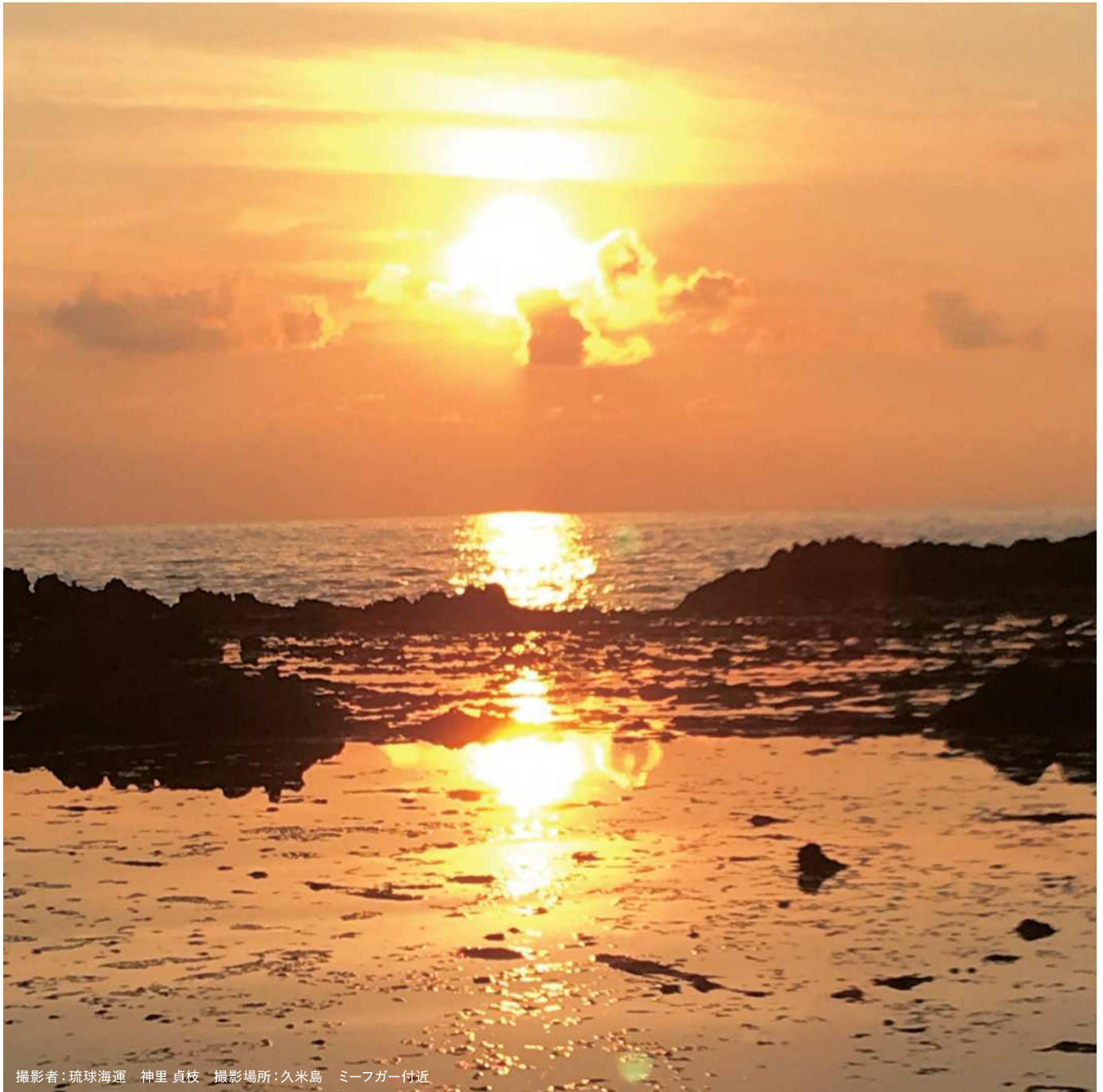
撮影場所：久米島 ミーフガー付近