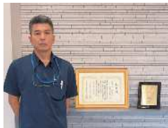
山戸センター長 豊見城営業所は 優秀安全運転事業所表彰金賞を受賞