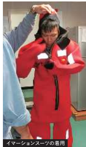
イマージョンスーツの着用