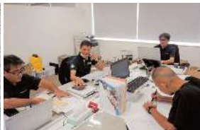
RLCプロジェクト推進室