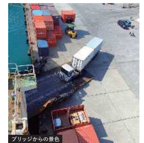
ブリッジからの景色

出港前に、三航士はメインフォーマンと連絡を取り、残りの積荷を確認し、出港時間の確定作業を行う。