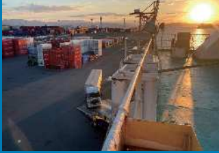
最終貨物到着でーす♪

無事荷役完了し、オモテ、トモ側ランブウェイ手前までコンテナを置き、本船を見送るまでの達成感は格別です。まだまだ不慣れとこともありますが、まだまだ不慣れとこともありますが、一日でも早く皆様のお力になれるよう、ご指導ご鞭撻のほど、引き続き宜しくお願い申し上げます。