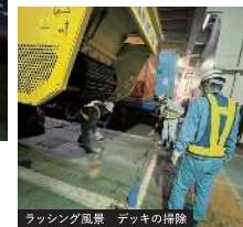
ラッシング風景 デッキの掃除

クローラー車両は泥などの塊が付いていることがあるため船内を走行したあとは、必ず掃除を行います。