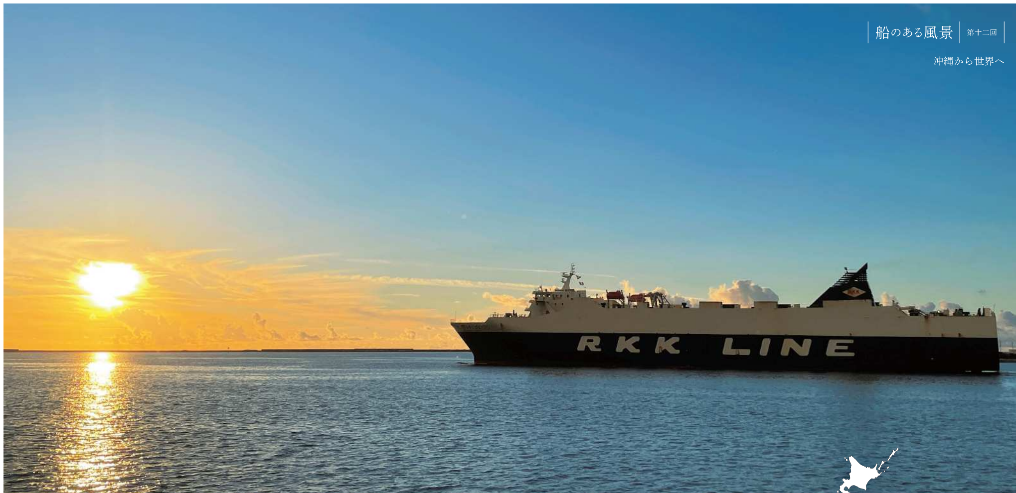
撮影場所：那覇クルーズターミナル内