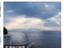
航海中の絶景 航海中にたまに見られる絶景。夏は満天の星空が最高!! 船乗りを辞められない理由の一つ。