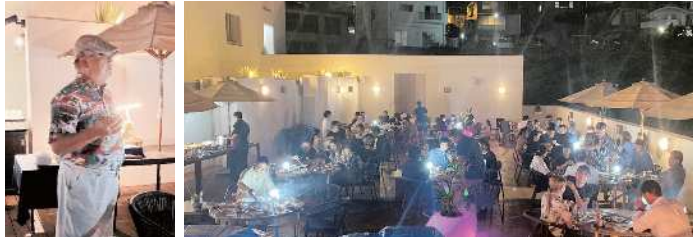
〔日程〕2023年9月9日(土) 〔場所〕ホテル沖縄那覇