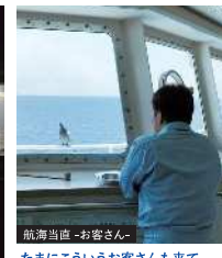
航海当直 -お客さん- たまにこういうお客さんも来て羽を休めて行きます。