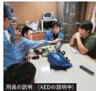
用具の説明（AEDの説明中）