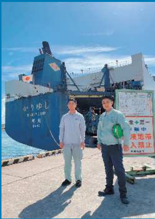
積み荷役開始前(本人:写真右)

初めてのメイン、あはやし★ ので、引き続きご指導ご鞭撻の程宜しくお願い致します。 中3の長男からは、「社長になつて戻つて来てね」を連発されているので、志高く頑張ります(笑)