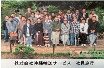
株式会社沖縄輸送サービス 社員旅行