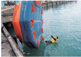
正常な状態に戻す方法(=復正:ふくせい)の実技

現在では、STCW条約(船員の免状等の資格に加えて、訓練やその技能の基準を定めた国際条約の規定により、当社の乗組員は全員この復正に加えて、冷たい海水から身を保護する「イマージョンスーツ」(11ページ写真参照:当社乗組員の着用訓練を着用し、長い時間漂流しながら救助を待つための技術やその方法、高い場所から海へ飛び込むための訓練を受けています。船員はこの技術が役に立つことのないように安全運航を心がけておりますが、技術は決して邪魔になるものではないため、本講習は非常に重要なものだと思えます。