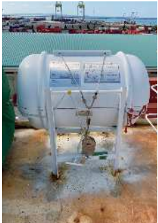
救命いかだ。普段はコンテナに入っている