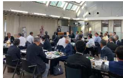
宮城社長のご挨拶